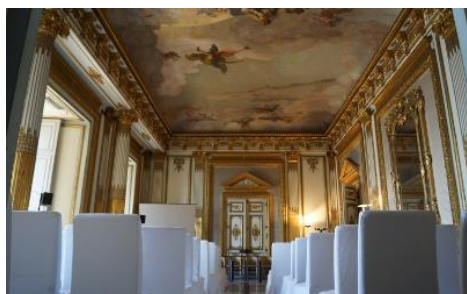
Palazzo du Mesnil Via Chiatamone, 61 – Napoli